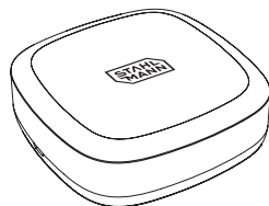
Рис. 1 Внешний вид датчика

Датчик протечки Stahlmann R868 предназначен для фиксации протечки воды и передачи, посредством радиоканала, аварийного сигнала на модули управления Stahlmann Smart и Stahlmann HUB.